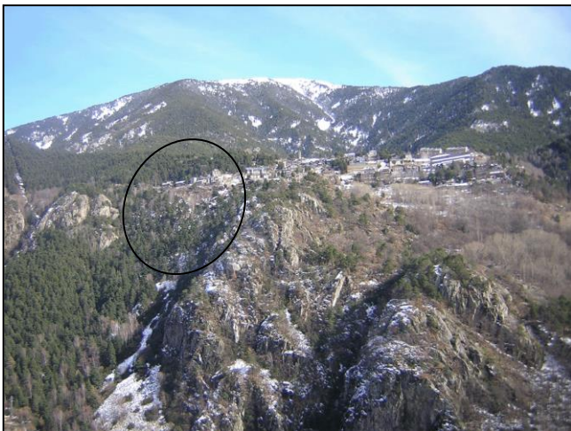
Obres de reparació d'un mur a la CS 200 situat a la capçalera del sector de l'Hortó